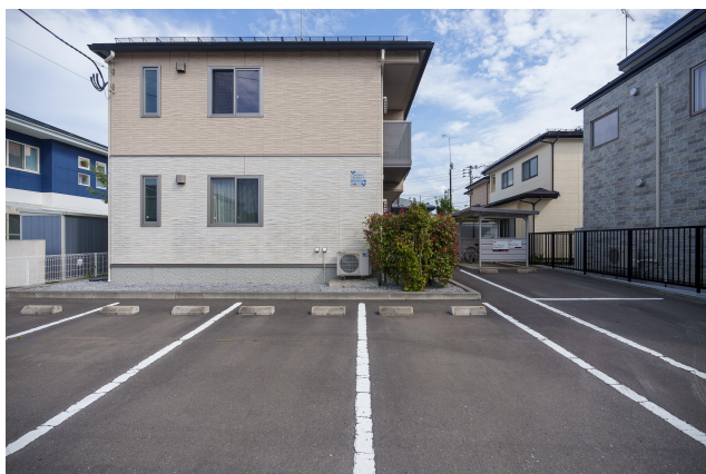
< シャーマゾンリラフォート 駐車場・物置配置図 >

積水ハウスの賃貸住宅『シャーマゾン』／オール電化で安全・安心しかも経済的／シャイド55（高遮音床）