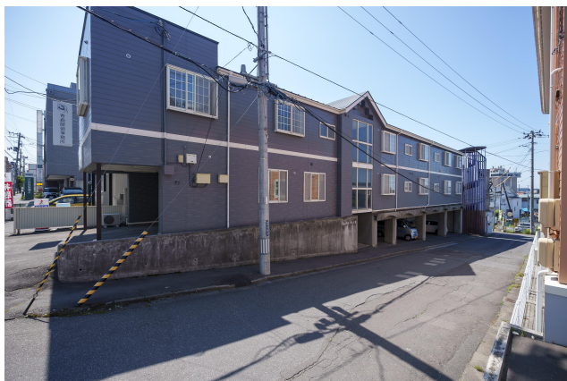
アマビーレパート II アパート