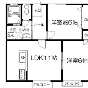
サザンコート（根城） 52.79㎡

※写真及び図面と現況が異なる場合には現況優先とさせていただきます。また、実際の間取りは図面と反転する場合があります。